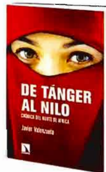
DE TÁNGER AL NILO Los Libros de la Catarata, Madrid, 2010

Seguí con mucha esperanza los comienzos aperturistas del reinado de Mohamed VI. El joven