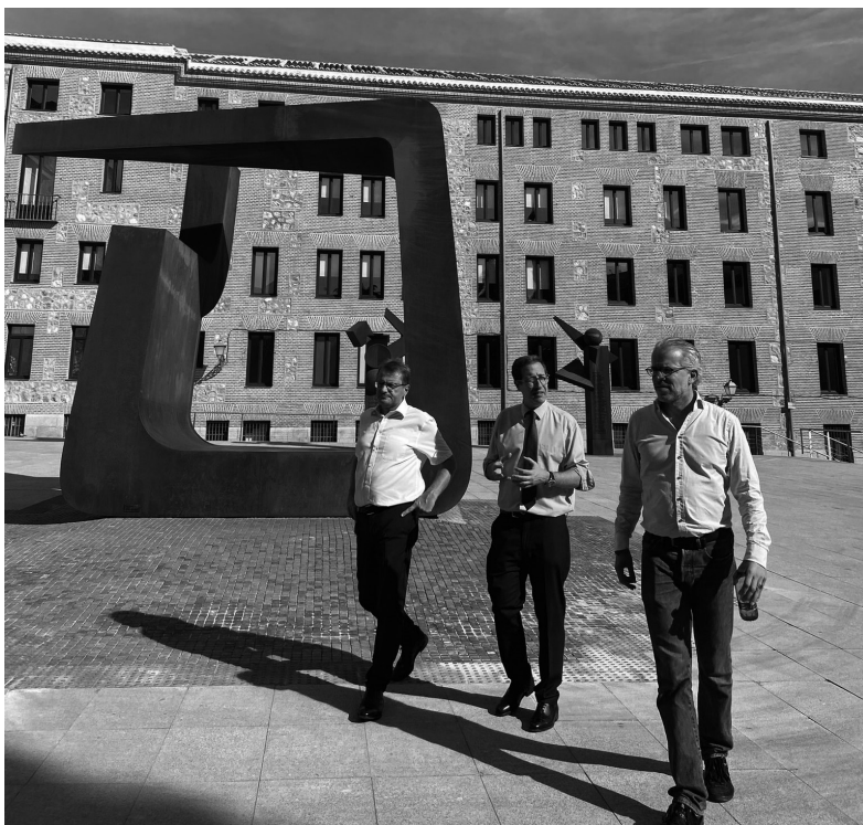
Domènec Ruiz Devesa, Hannes Heide y Thijs Reuten, diputados al Parlamento Europeo por el Grupo de los Socialistas y Demócratas, en Madrid, frente al monumento a los madrileños deportados a Mauthausen, el 27 de septiembre de 2023.

HANNES HEIDE, 28 de septiembre de 2023 Diputado al Parlamento Europeo, Socialistas y Demócratas Excalcalde de Bad Ischal, Austria (2007-2019)