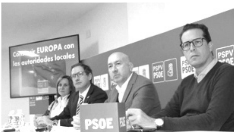
Domènec Ruiz Devesa en la presentación del programa BELC junto con el alcalde de Elda, Rubén Alfaro, la alcaldesa de Xixona, Isabel López, y el secretario general del PSPV-PSOE de Alicante y diputado en el Congreso, Alejandro Soler, el 28 de noviembre de 2022.