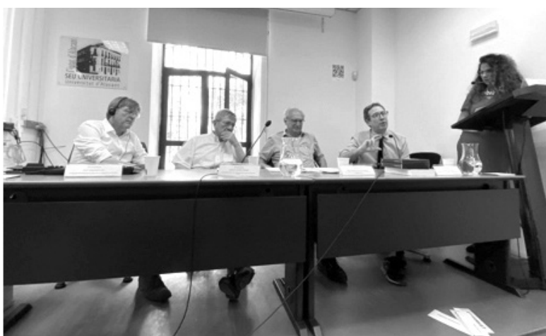
Domènec Ruiz Devesa con el expresidente del Parlamento Europeo, Enrique Barón Crespo, Guy Verhofstadt, ex primer ministro de Bélgica y diputado al Parlamento Europeo, y Francisco Aldecoa, presidente del Consejo Federal Español del Movimiento Europeo, durante el encuentro de la Unión de los Federalistas Europeos (UEF) "El futuro de Europa tras la guerra en Ucrania", el 29 de abril de 2023.

ENRIQUE BARÓN CRESPO, 2 de febrero de 2024 Presidente del Parlamento Europeo (1989-1992), presidente de la Unión de Europeístas y Federalistas de España