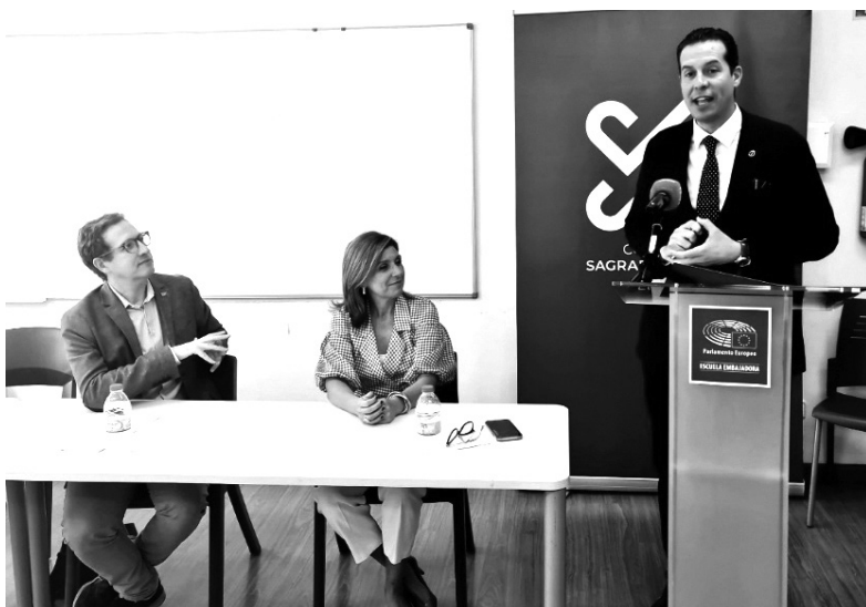
Visita de Domènec Ruiz Devesa y Rubén Alfaro al Colegio Sagrada Familia de Elda, el 5 de mayo de 2023.

Durante su estancia en Elda, Domènec Ruiz mantuvo un encuentro con alumnos y alumnas del Colegio Sagrada Familia en el que tuvo la oportunidad de explicarles el funcionamiento de instituciones como el Parlamento Europeo y las diferentes iniciativas y programas que se ponen en marcha y se impulsan desde la Unión Europea. Como dijo el europarlamentario socialista durante su conversación con el alumnado del centro educativo eldense, es fundamental que los más jóvenes sean conscientes de lo que supone pertenecer a la UE y de los derechos y valores que representa porque ellos y ellas son la garantía de su continuidad.